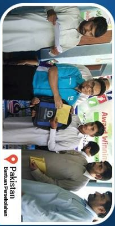
Pakistan Bantuan Kesihatan